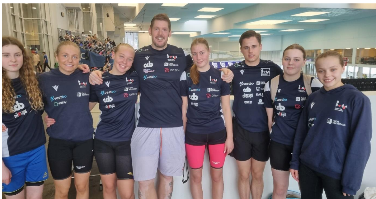
Trenerteamet med noen av utøverne våre som deltok på årets Bergen Swim Festival

Bergen Swim Festival er det største internasjonale svømmestevnet i Norge. Årets utgave samlet hele 942 deltakere, og det var invitert til en skikkelig svømmefest i AdO arena. Derfor var det veldig gledelig at våre utøvere presterte jevnt over veldig godt. Mange tok fine steg fremover.