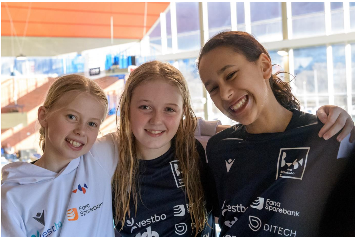
Samhold, idretts glede og fellesskap stod i fokus da 32 av våre utøvere deltok på årets ZEEKIT LÅMØ Vest i Førde

I det neste nyhetsbrevet skal vi skrive litt mer om ZEEKIT ÅM, og hvordan opplevelsen var for våre utøvere, trenere og reiseledere.