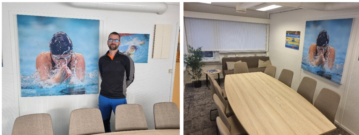
Vår dyktige fotograf Peter Aglen/aglenphoto med det nye bildet på vårt oppussede møterom

Vi ønsker å være tilgjengelig for ansatte, medlemmer og våre venner i svømme- og idrettsfamilien. Derfor håper vi at mange vil ta turen innom oss for en kaffe og en hyggelig prat.